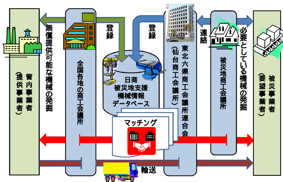
「遊休機械無償マッチング支援プロジェクト」スキーム図

現在、使用せずに眠っている機械、入れ替えで不要になる機械などを被災地の事業所の支援に無償でご提供ください。