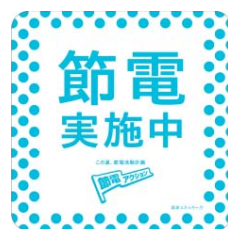
節電宣言ステッカー

節電行動計画を、 政府の節電ポータルサイト 「節電.go.jp」で公表いただく 皆さまには、「節電宣言ステッ カー」を差し上げます。 オフィスの受付に、店舗の入り 口に提示しましょう。