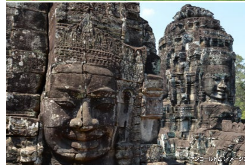
アンコールワット(イメージ)