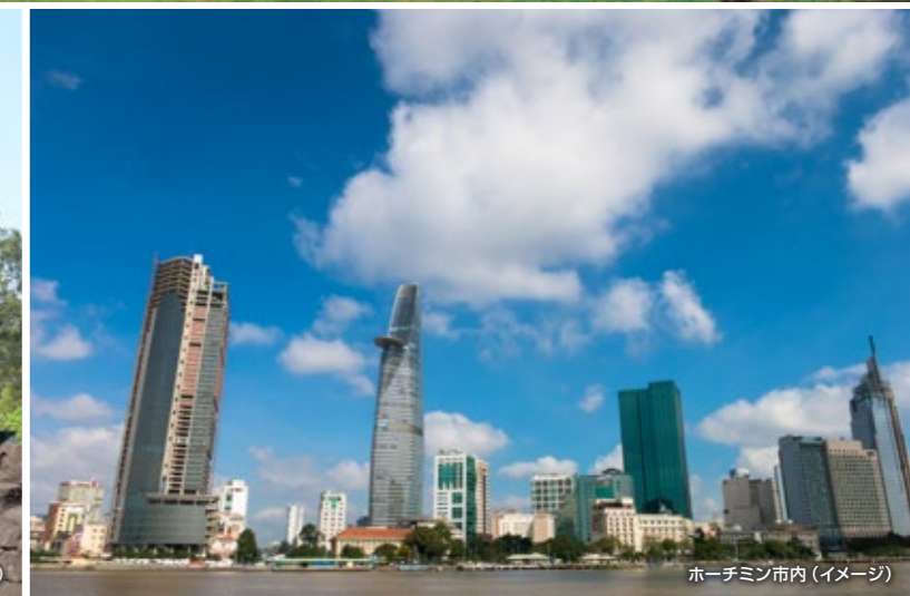
ホーチミン市内(イメージ)