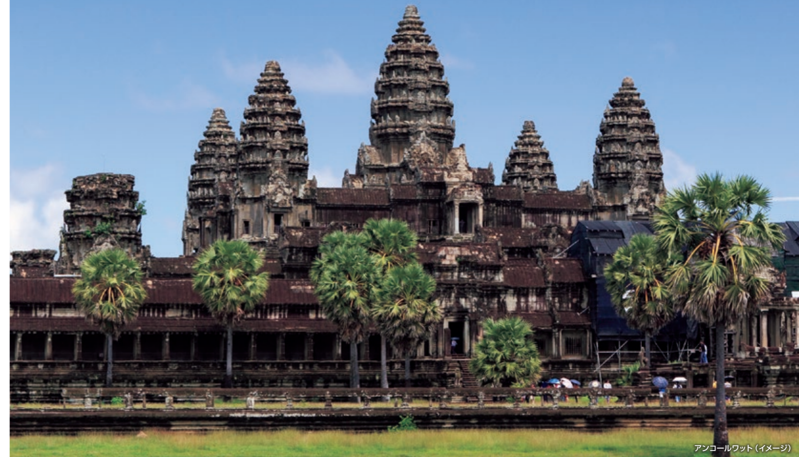
アンコールワット(イメージ)