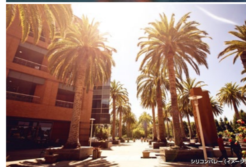
シリコンバレー(イメージ)